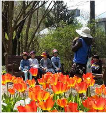
푸른 새싹과 아름다운 꽃이 함께하는 봄