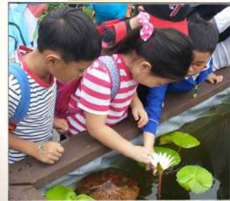
교과서에서 본 식물이야!